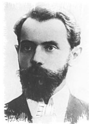
Леонид Борисович Красин. 1904 год

Среди памятных дат ушедшей советской эпохи день рождения Леонида Борисовича Красина (15 июля 1870 года) если и значился, то проходной, обычной строкой. 100-летний юбилей Красина не был отмечен в Советском Союзе сколько-нибудь значимыми мероприятиями. Ему не поставили памятник, его именем не назвали ни один населенный пункт, его статьи и выступления не вышли отдельным изданием. Между тем все это Красину было положено даже по формальным историко-партийным