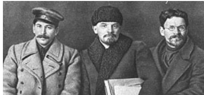
Иосиф Сталин, Владимир Ленин и Михаил Калинин на VIII съезде РКП(б). Март 1919 г