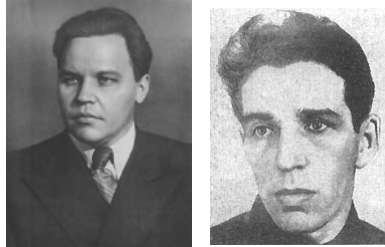
Николай Вознесенский и Алексей Кузнецов

Пятьдесят лет назад, 1 октября 1950 года, были расстреляны бывший первый заместитель председателя Совета министров СССР, председатель Госплана СССР, член Политбюро ЦК ВКП(б) Николай Вознесенский и бывший секретарь ЦК ВКП(б), начальник Управления кадров ЦК Алексей Кузнецов, о которых Сталин в 1948 г. в узком кругу соратников говорил как о самых подходящих кандидатурах на посты председателя Совета министров (Вознесенский) и генерального секретаря ЦК ВКП(б) (Кузнецов) после его смерти. Почему же он переменял свое мнение об этих людях и дал санкцию на их уничтожение? На сей счет среди историков есть несколько точек зрения, и сопоставление их способно лишь еще больше запутать так называемое «ленинградское дело», жертвами которого стали несостоявшиеся наследники Сталина. Однако для понимания причин устранения Вознесенского и Кузнецова анализа хитросплетений «ленинградского дела» явно недостаточно. Сводить все дело к интригам Берии и Маленкова, сыгравших на усилившейся к концу жизни маниакальной сталинской подозрительности, значит говорить только об одной стороне проблемы. До того как очутиться в роли подследственных, Возне-