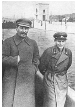
Сталин и Ежов на канале Москва-Волга.

Человек в ежовых рукавицах – именно в таком обличье нередко предстал в советских газетах 1937 года всеильный нарком внутренних дел СССР Николай Иванович Ежов, человек достигший в том кровавом году пика своей блистательной карьеры. С осени 1938 года на страницах газет уже не встретишь таких рисунков, равно как и восхваляющих Ежова виршей казахского поэта-акына Джамбула Джабаева («Храбрее кто барсов и зорче орлов – любимец страны